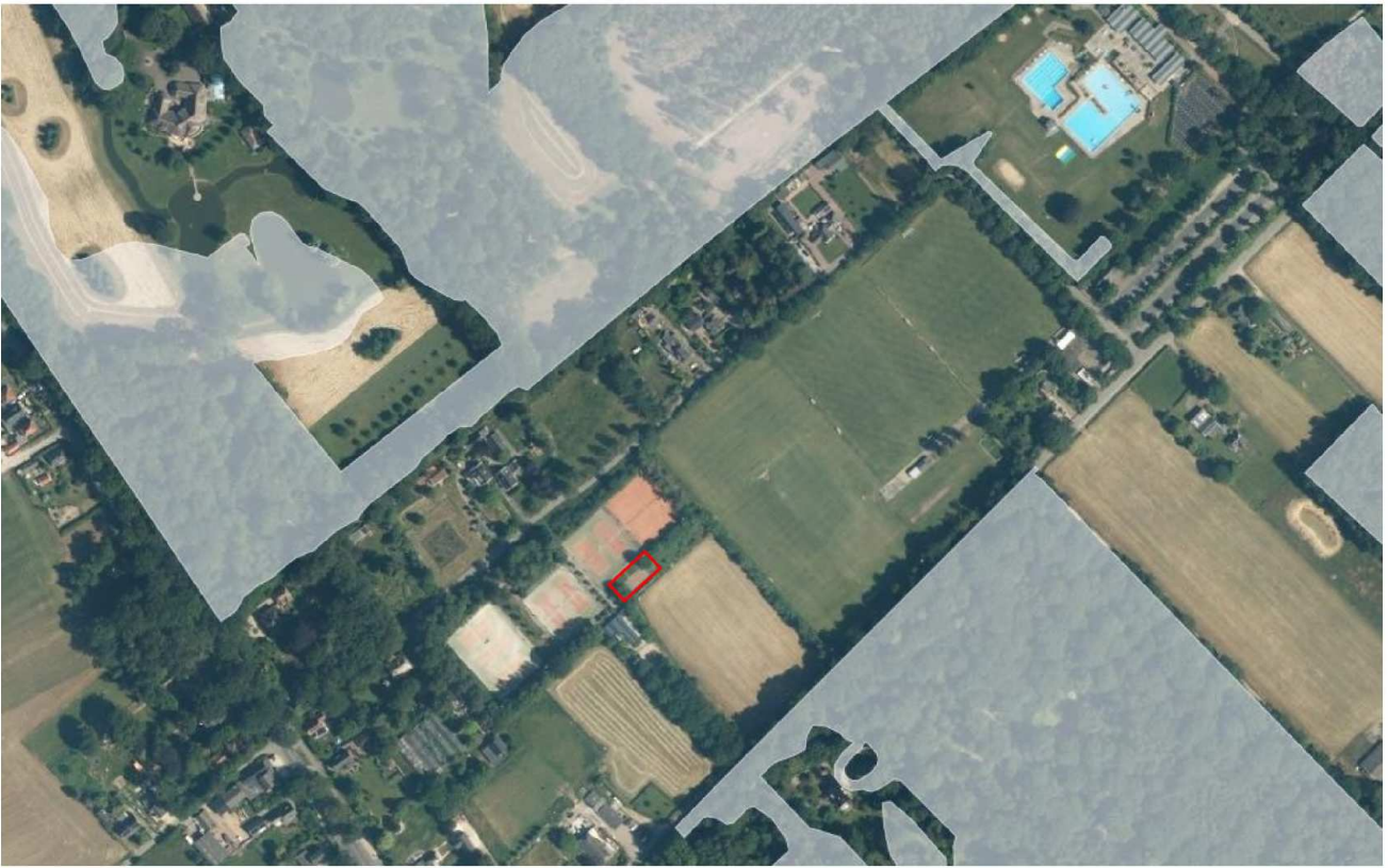
Afbeelding 7: ligging van de het plangebied (rood) ten opzichte van het NNN (wit).

Het plangebied ligt niet in het Gelders Natuurnetwerk (GNN) (afbeelding 7). Er worden dan ook geen effecten op de wezenlijke kenmerken en waarden van het GNN verwacht. Een verdere toetsing is niet noodzakelijk.