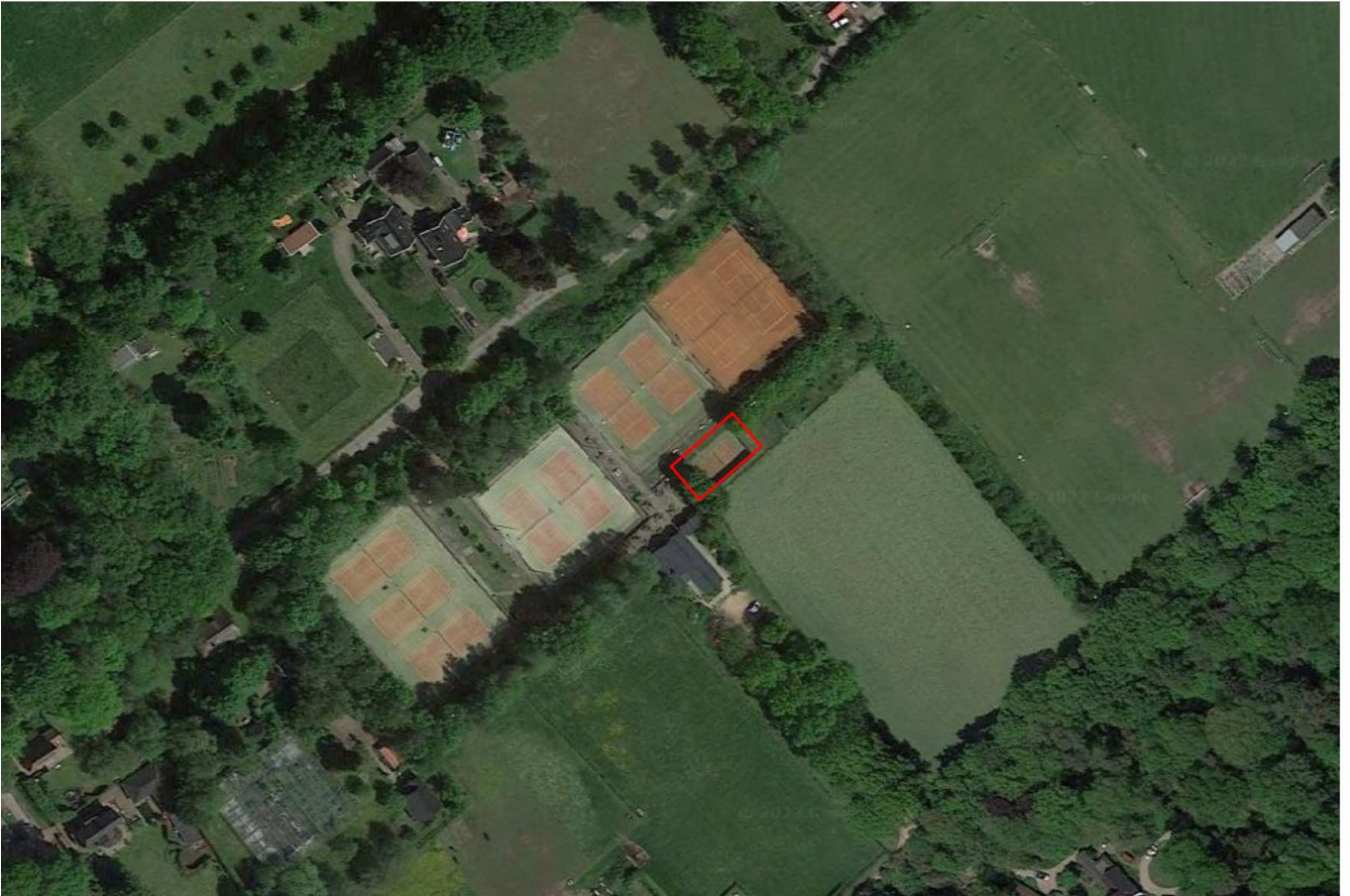
Afbeelding 1: toekomstige locatie padelbanen (rood)

Men is voornemens om twee padelbanen direct naast elkaar te realiseren, de wanden van de padelbanen worden hierbij uitgevoerd in glas. Hiervoor wordt een kleine tennisbaan afgebroken en worden mogelijk enkele struiken verwijderd.