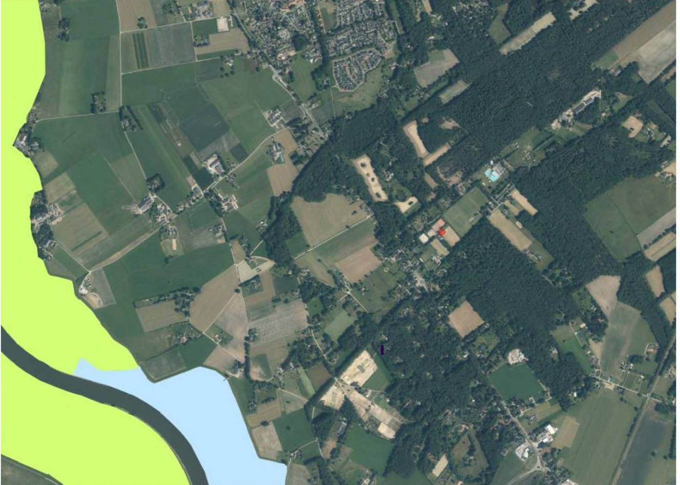
Afbeelding 3: de ligging van het plangebied (rood) ten opzichte van de Natura 2000-gebied 'Rijntakken' (blauwgroen).

Het plangebied ligt op circa 1,4 kilometer van het Natura-2000 gebied 'Rijntakken' (afbeelding 3). Overige Natura 2000-gebieden liggen op grotere afstand van het plangebied. Gezien de aard van de werkzaamheden en de afstand tot het dichtstbijzijnde Natura-2000 gebied, worden negatieve effecten als oppervlakteverlies, versnippering en verstoring door licht en geluid op Natura-2000 gebieden verwacht.