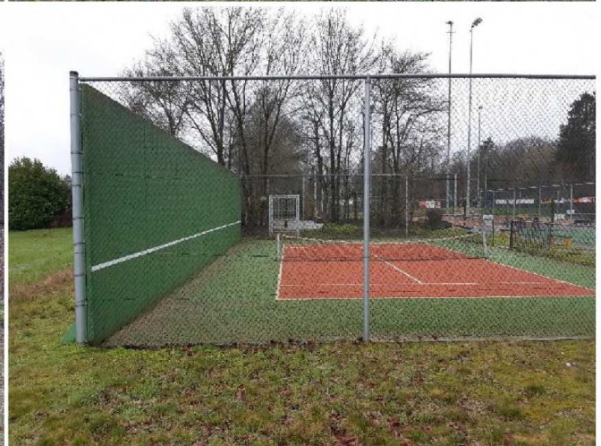
Afbeelding 2: impressie van het plangebied