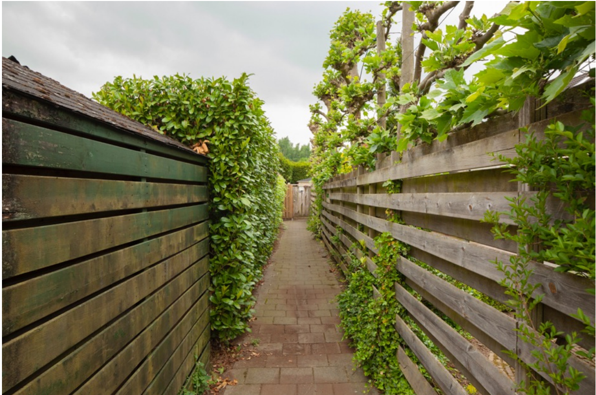
Foto: Het Have in Eefde, achterpad van de gemeente dat niet verlicht wordt.