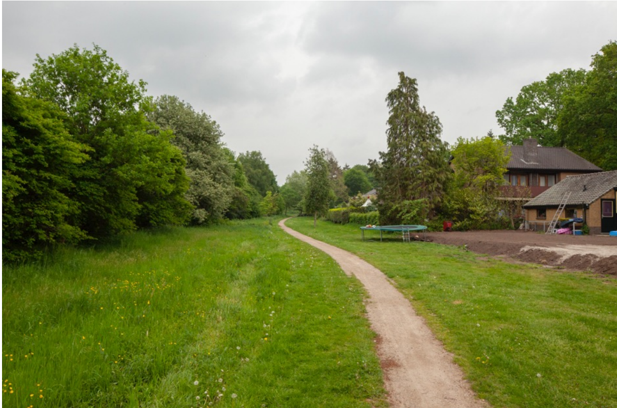
Foto: Meierinkstraat in Eefde, een pad dat veel gebruikt wordt om de honden uit te laten.

Sociale veiligheid (en dan vooral het gevoel van veiligheid) speelt met name een rol op losse voetpaden. Vaak worden deze voetpaden gebruikt om de honden uit te laten.