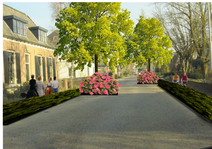
Opwaarderen entree Eefde: kleurig accent