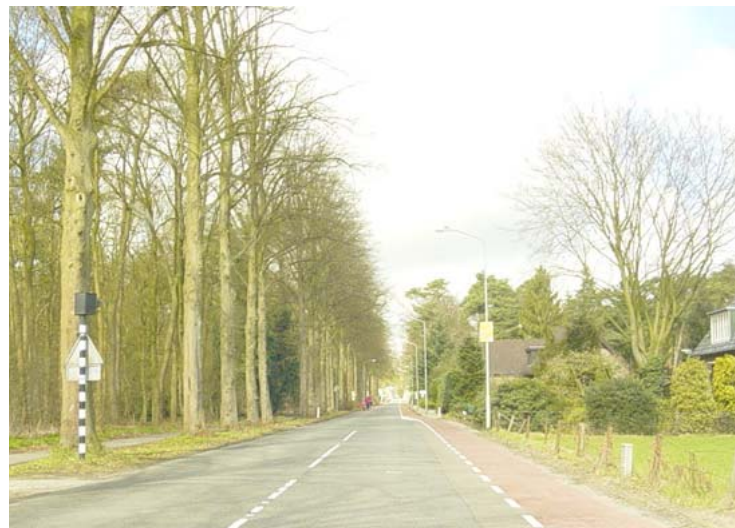
Entree Barchem Ruurloseweg

In Barchem is geen industrieterrein aanwezig.