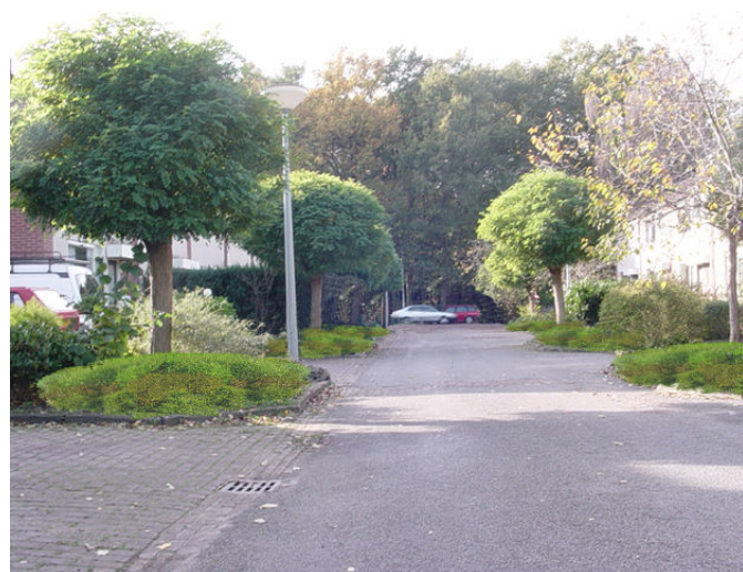
Eenduidige lage beplanting schept rust en overzicht