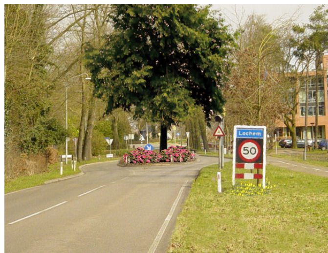
Accent entree Lochem