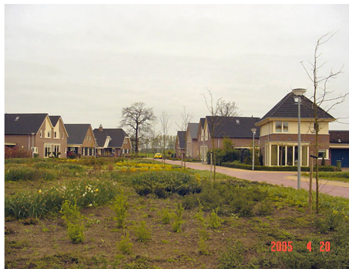
Dorrewold Gorssel: groot gebruiksgebied; erg intensief in beheer

De randen (groen rondom de begraafplaatsen) kunnen wellicht meegenomen worden in ecologisch beheer. Het groenbeheer van het overige deel van de begraafplaatsen wordt nog nader uitgewerkt.