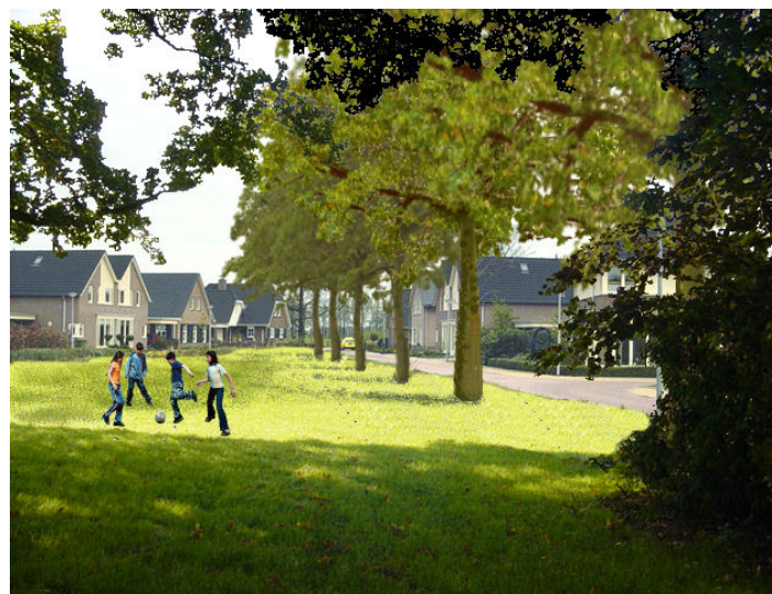
Dorrewold Gorssel: andere inrichting schept nieuwe gebruiksmogelijkheden