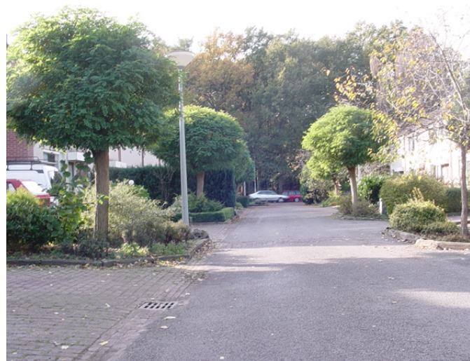
Woonstraat Gorssel: onduidelijk en onoverzichtelijk