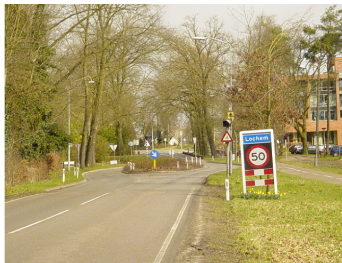
Entree Lochem Barchemseweg

In het centrumgebied en ter plaatse van de accenten wordt geen groen afgestoten omdat het groen een belang heeft op dorps- of zelfs regionaal niveau.