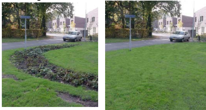
Onduidelijk groen / duur in beheer Eenvoud schept duidelijkheid

Grote groenstroken in een woongebied kunnen in aanmerking komen voor ecologisch groenbeheer. Voorwaarde is wel dat de verstoring door verkeer of intensief gebruik minimaal is. Ook is aansluiting op ecologisch beheerde groenstroken in de omgeving van belang.