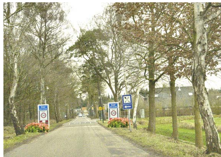
Entree met accent