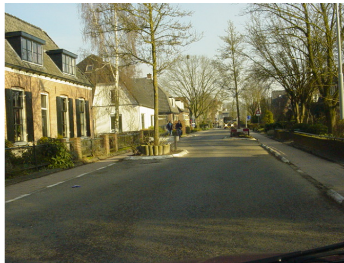
Entree Eefde Kapperallee

In Eefde is geen industrieterrein aanwezig.