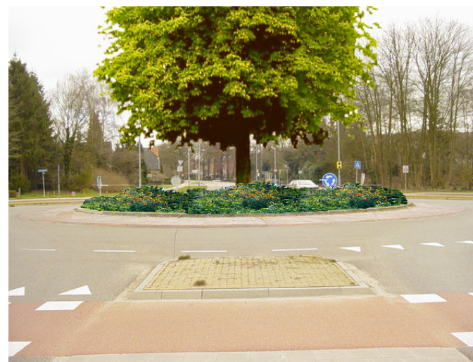
Rotonde als accent: oriëntatiepunt en sierplantsoen