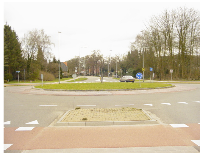
Rotonde Zutphenseweg Lochem

Op de hoofdontsluitingswegen komen enkele rotondes en chicanes voor. Op deze plekken is het mogelijk om accenten te leggen. Op de meeste plekken valt dit samen met de entree van een woonkern. Om op een goedkope en toch representatieve wijze om te gaan met deze entrees, worden de plantvakken in de rotondes en chicanes vergeven aan hoveniers. De betreffende hovenier gaat met de Gemeente Lochem een zogenaamde adoptieovereenkomst aan waarin o.a. de rechten en plichten over aanleg, onderhoud en reclameborden staan beschreven. Voor de rotondes/chicanes op de provinciale wegen, zal contact gezocht worden met de provincie om de mogelijkheden voor de betreffende rotondes/chicanes te bespreken.