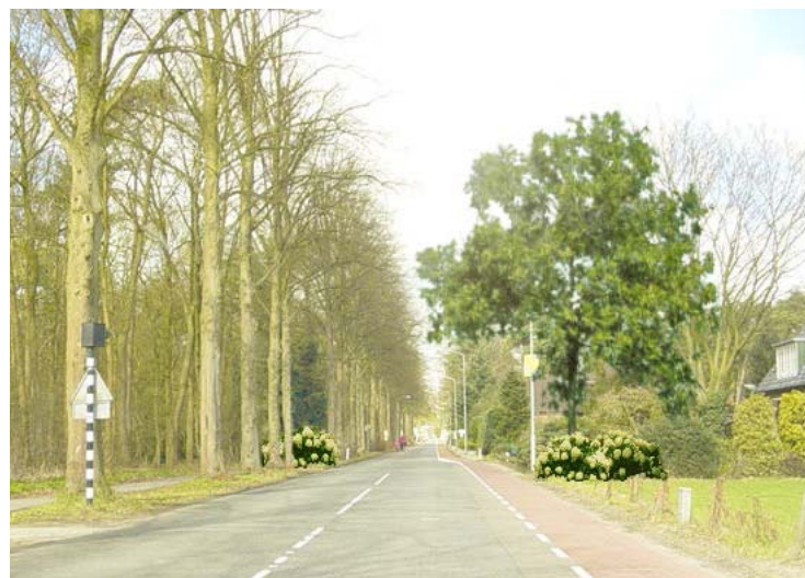
'Poort-effect' door aanbrengen beplanting