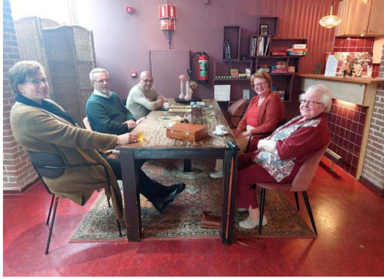
Inwoners van Eefde genieten samen met vrijwilligers van Huiskamer Het Hart van een kopje koffie en een praatje.