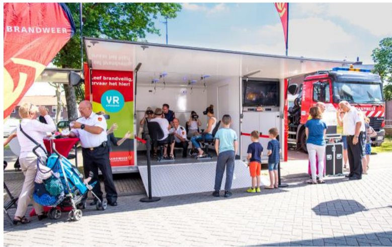
Ga 22 mei in gesprek met de gemeente, politie en brandweer in Eefde, op het plein bij de Schurinklaan.

Afgeplakte ramen, een vreemde geur, veel activiteit bij een pand op vreemde tijden. Of een winkel waar u alleen contant kunt betalen. Dit zijn signalen die kunnen duiden op ondermijnende criminaliteit. Gemeente Lochem zet zich in voor een leefbare en veilige omgeving. En pakt ondermijning aan. Daarom kunnen inwoners op 22 mei van 9.00 tot 17.00 uur de Ondermijningsbus bezoeken in Eefde, op het plein bij de Schurinklaan. De gemeente geeft hier voorlichting om inwoners alert te maken. De brandweer is er ook. Bezoekers komen met virtual reality veel te weten over brandveilig leven.