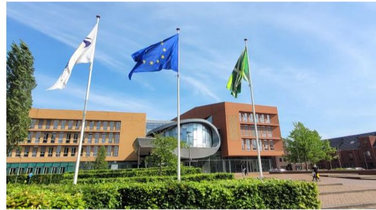
Bij ons gemeentehuis wappert de Europese vlag tot en met 6 juni. De dag van de Europese verkiezingen.

Op donderdag 6 juni kunt u uw stem uitbrengen voor de leden van het Europees Parlement. Hieronder leest u belangrijke informatie hierover.