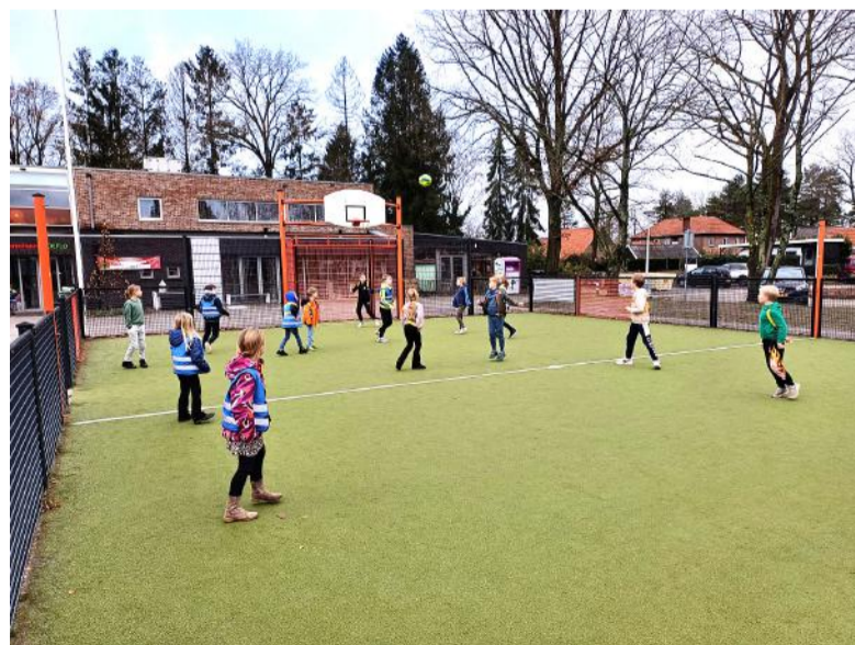
Basisschoolkinderen uit Gorssel, Laren en Epse kunnen gratis meedoen aan multisport en zo ontdekken welke sporten zij leuk vinden.