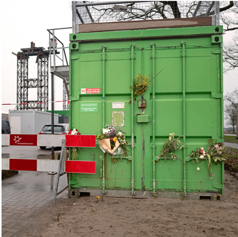
Iedereen leeft erg mee na het brugongeluk vorige week woensdag. Zo laten mensen bloemen achter bij de groene bouwcontainer aan de Goorseweg.