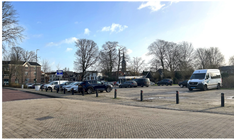
De in- en uitrit van het parkeerterrein aan de Mauritsweg verplaatsen we naar het kruispunt Graanweg/Mauritsweg.

Nu blijkt dat deze parkeerplekken ook in de toekomst nodig zijn