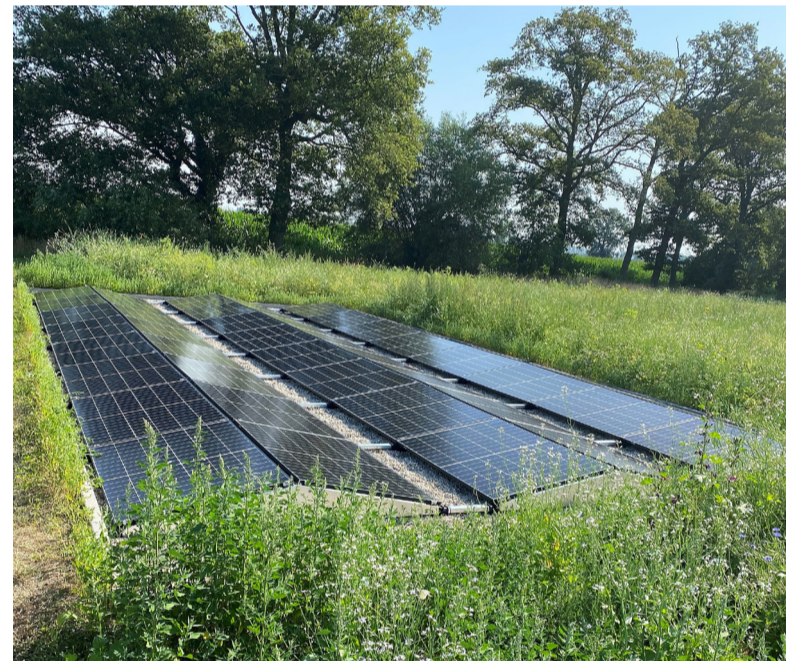
Volgens het nieuwe beleid mogen inwoners maximaal 2 hectare oppervlakte zonnepanelen plaatsen.

Kleinschalig en lokaal opwekken van duurzame energie wordt steeds belangrijker. Daar zijn duidelijke regels en voorwaarden voor nodig. Vorige week stemde het Lochemse college in met het nieuwe beleidskader voor kleinschalige zonne-energie. De regels zijn vooral voor Lochemers die voor eigen gebruik op eigen grond een zonnepaneel willen plaatsen.