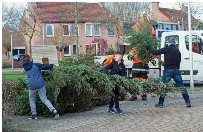
Bij de kerstbomeninzameling werden in totaal 2300 kerstbomen ingeleverd.

Grote en kleinere bomen, met en zonder naalden en een enkele keer met kluit: bij de kerstbomeninzameling werden vorige week in totaal 2300 kerstbomen ingeleverd. Op negen inzamelpunten in de gemeente stonden Circulus-medewerkers klaar om de bomen aan te nemen. Ook dit jaar in ruil voor 50 cent per boom.