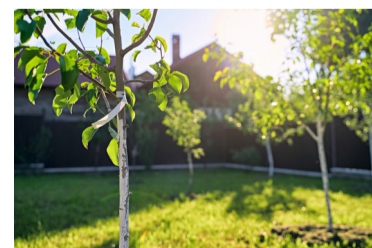
Bomen bevorderen een groene leefomgeving.

Zaterdag 16 december 2023 konden inwoners uit de kernen de jonge bomen ophalen. Vanaf twee verschillende locaties deelde agrarische natuurvereniging 't Onderholt 141 jonge bomen uit.