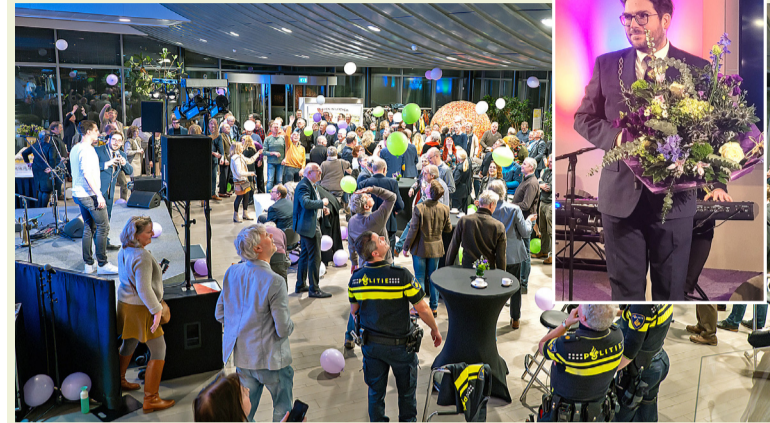
De nieuwjaarsreceptie van onze gemeente werd goed bezocht.