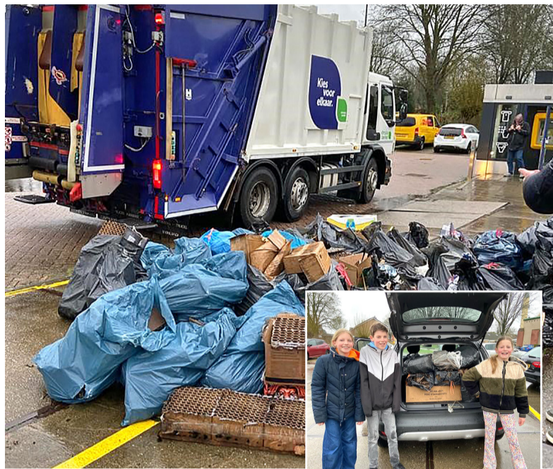
In verschillende kernen ruimden jongeren en kinderen vuurwerkafval op en leverden het in bij het inzamelpunt van Circulus.

Opruimen is 'heel gewoon' Circulus en Welzijn Lochem organiseerden de actie 'Friet voor vuurwerk' weer in opdracht van de gemeente. Ondanks het slechte weer leverden jongeren het nodige vuurwerkafval in. Lochem sprong eruit qua aantallen. Ook in de