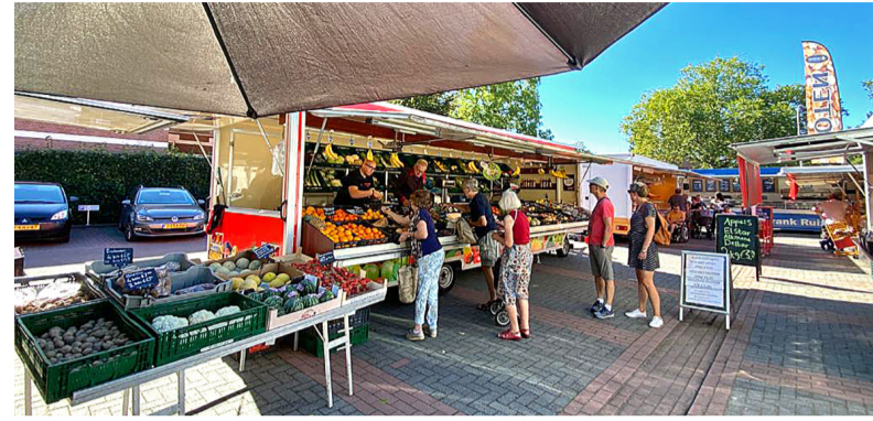
De afgelopen maanden vond de weekmarkt plaats naast Goossens. Nu dus weer terug op de Lochemse Markt.

De weekmarkt in Lochem is vandaag, woensdag 10 januari, terug op de oude vertrouwde plek. De grote Markt is aangepakt en weer klaar om wekelijks de kramen van de verschillende ondernemers te ontvangen. De marktondernemers heten u van harte welkom!