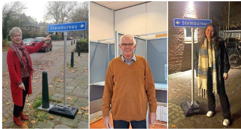
Dank aan alle vrijwilligers in de stembureaus.

In de tabel in dit artikel staan de 10 partijen opgesomd. De partij met de meeste stemmen bovenaan, aflopend naar de partij met de minste stemmen onderaan.