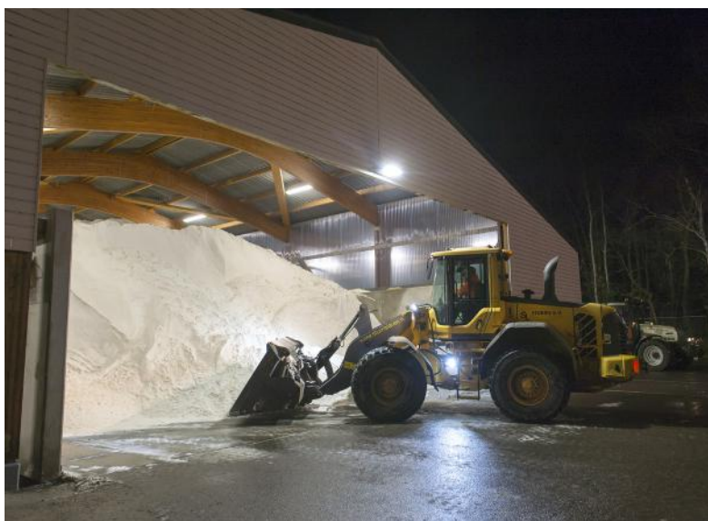
Verwachten we gladheid? Dan gaan de strooiwagens eropuit.

De strooiwagens in onze gemeente halen het zout uit grote steunpunten in Ruurlo en Warnsveld. Het zout is in een grote