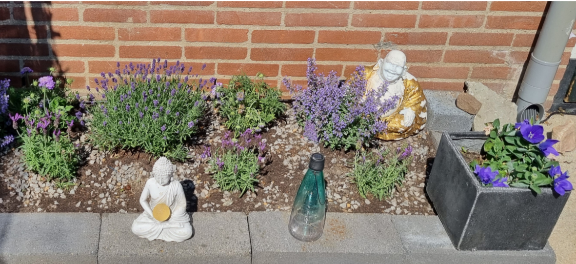
Monique en Hans wipten 35 tegels uit hun tuin. Volgt u hun voorbeeld?

Monique en Hans vonden hun betegelde tuin maar ongezellig. En ze wilden graag de bijen helpen. Dus stroopten ze hun mouten op en wipten 35 tegels uit hun tuin. Een deel daarvan werd tuin met mooie planten, zoals lavendel en passiebloem. Hun tuin is nu weer een plek waar ze graag zijn.