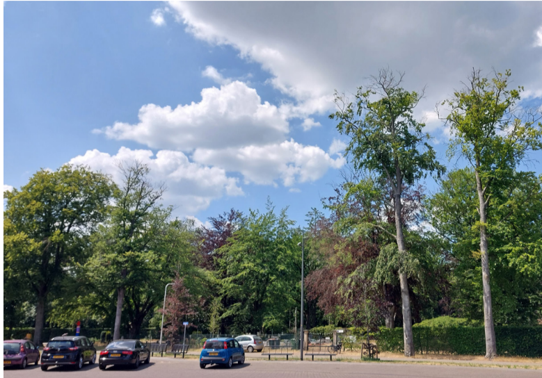
De vijf beuken op en bij de begraafplaats in Barchem zijn ziek.

Circulus snoeit binnenkort de bomen zodat het dode hout eruit is en schermt ze af zodat geen onveilige situaties ontstaan. In de winter herplanten we nieuwe bomen. Langs de Beukenlaan gaat het om drie nieuwe beuken. We zorgen voor een optimale standplaats, zodat de kans dat ze goed aanslaan zo groot mogelijk is. Op de begraafplaats kiezen we voor twee andere soorten, die goed bestand zijn tegen een veranderend