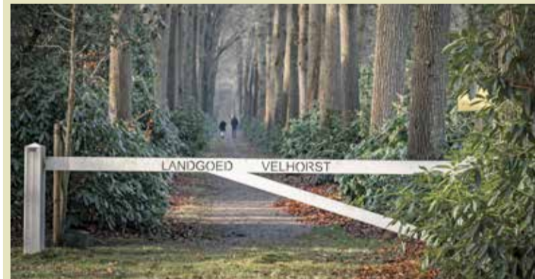
We wisten het natuurlijk al, maar in onze gemeente kan iedereen mooi wandelen.

Lochem mag zich in 2022 'Wandelgemeente van het jaar noemen', maakte de organisator van de wedstrijd, Wandelkrant Te Voet, dinsdag 18 april bekend. Onze gemeente ging er met maar liefst 46% van de stemmen vandoor. De vakjury, bestaande uit wandelredacteuren gaf de uiteindelijke doorslag.