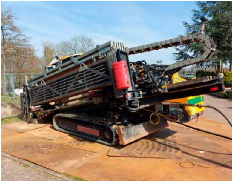
Met deze grote machine is de waterstofleiding onder de Berkel geboord.

Nederland gaat van het aardgas af en dat betekent dat we huizen op een andere manier moeten gaan verwarmen. Eén van de oplossingen kan waterstof zijn. In de Lochemse wijk Berkeloord loopt hiermee een pilot. Netwerkbijbedrijf Alliander gaat 10-15 woningen voorzien van waterstof om hiermee ervaring op te doen. De voorbereidingen zijn op dit moment in volle gang. In het najaar stroomt er echt waterstof naar de deelnemende huizen toe. In dit artikel nemen wij u mee in deze duurzame ontwikkeling.