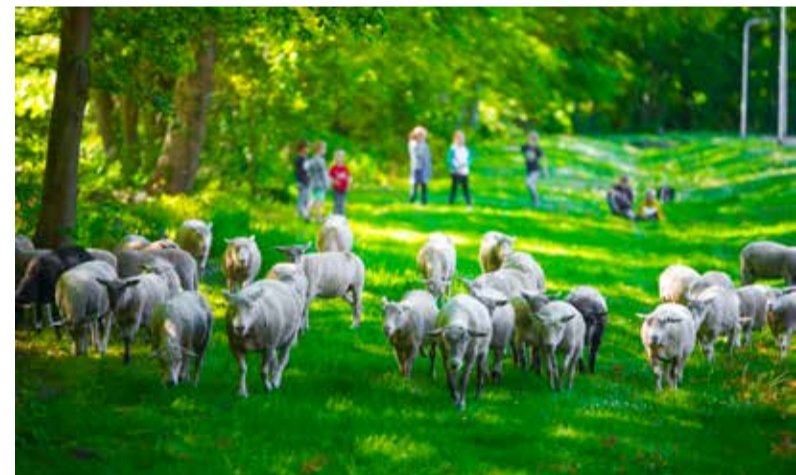
Schappen grazen op gemeentelijke gazons en bermen in Eefde en Gorssel.

Vanaf 25 april ziet u ze weer grazen op gemeentelijke gazons en bermen in Eefde en Gorssel: schapen. Twee kudde maken ook dit jaar 'graasrondes' door en langs deze dorpen. Ze vervangen op veel plekken het maaiwerk met machines en houden kruiden en andere planten kort. De dieren zijn dus hard aan het werk!