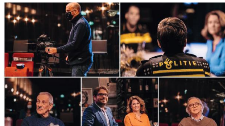
De uitzending is te bekijken via www.allemaal1.tv of direct op het YouTube kanaal van Allemaal1.tv.

Op 24 december kunt u om 18.30 uur kijken naar de speciale kerstuitzending van Allemaal1.TV. Met daarin weer gasten uit onze verschillende kernen. Door de aangescherpte coronamaatregelen is het geen live-televisie. De gesprekken zijn vooraf opgenomen in tijdvakken.