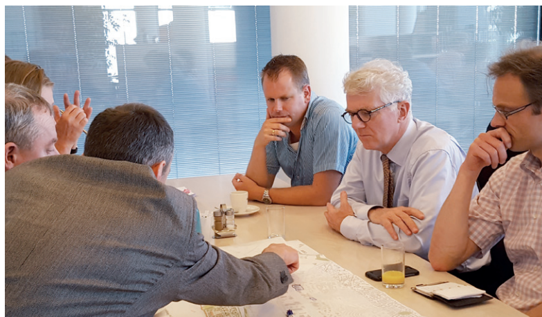
Werkessie met het Lochemse bedrijfsleven, gemeente, Cleantechregio, provincie, Circulus-Berkel en energiedeskundigen

Kan de kanaalzone in Lochem de energie-ader van de stad worden? En kunnen de bedrijven samen de omslag maken van fossiele naar duurzame energie? Dat is de centrale vraag in het project 'Groene Fabriek Lochem'. Afgelopen periode is verkend welke kansen er liggen én welke verder kunnen worden uitgewerkt. Er liggen heel veel kansen. Van energiebesparing, uitwisseling en productie tot duurzame mobiliteit. De uitdaging is welke kansen praktisch kunnen worden.