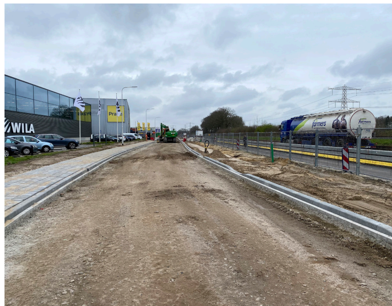
De Kwinkweerd in Lochem is bijna klaar. De aanpassing van de weg is onderdeel van het project Schakel Achterhoek-A1

De asfaltwerkzaamheden zijn weersafhankelijk. Bij (erg) nat weer kan het gebeuren dat BAM de werkzaamheden uitstelt. Als dat het geval is, laten ze dat zo snel mogelijk weten.