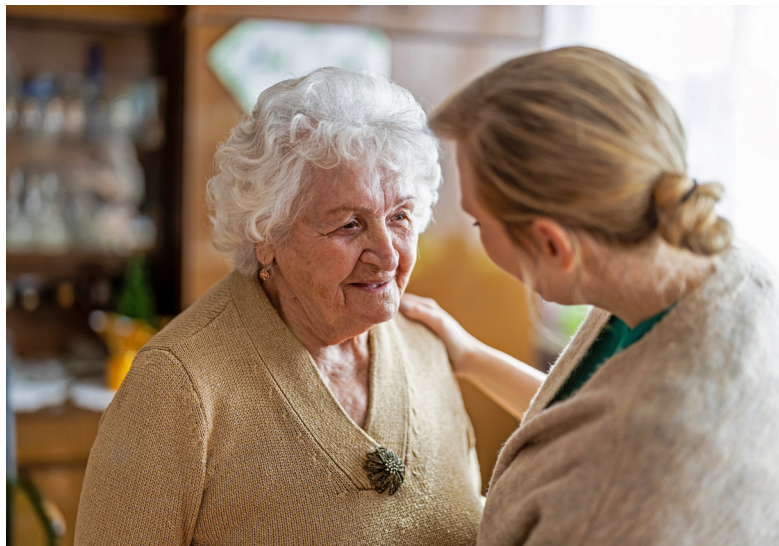
Inwoners in onze gemeente weten steeds beter en meer hun weg te vinden naar de welzijnscoördinatoren.

Welzijnscoördinatoren helpen inwoners in de Lochemse kernen op een laagdrempelige manier hun weg te vinden naar informele en formele zorg, hulp en ondersteuning. Zij zijn daarmee van grote toegevoegde waarde voor de Lochemse samenleving. Dat is de afgelopen jaren wel gebleken. Daarom stelt het college van B&W de gemeenteraad voor om hen structureel budget te geven. Hiermee kunnen zij hun werkzaamheden voortzetten en waar nodig uitbreiden. De raad behandelt het voorstel naar verwachting in juni.